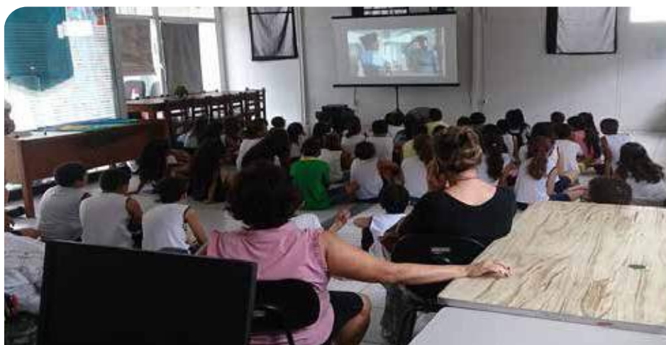
Cineclube Dia da Consciência Negra (SEMUC, 2018)