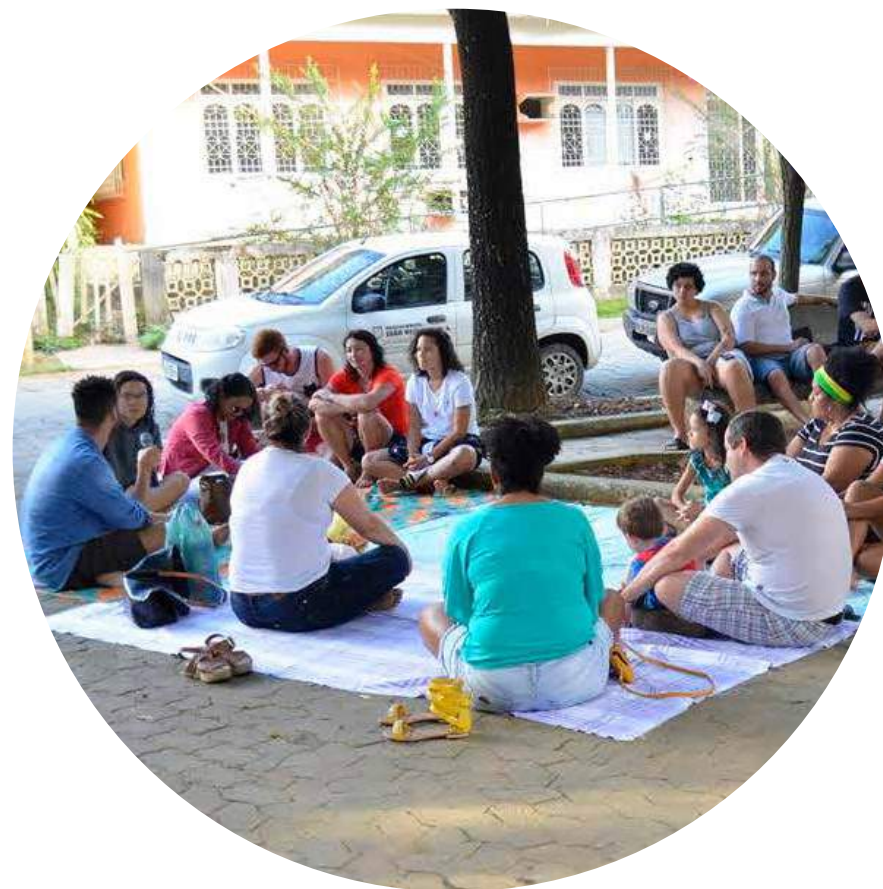
II Piquenique das Cores em João Neiva (SEMUC, 2018)