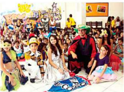
Cerca de 250 alunos participam das Oficinas de Arte, promovida pela Secretaria Municipal de Cultura, Turismo e Juventude