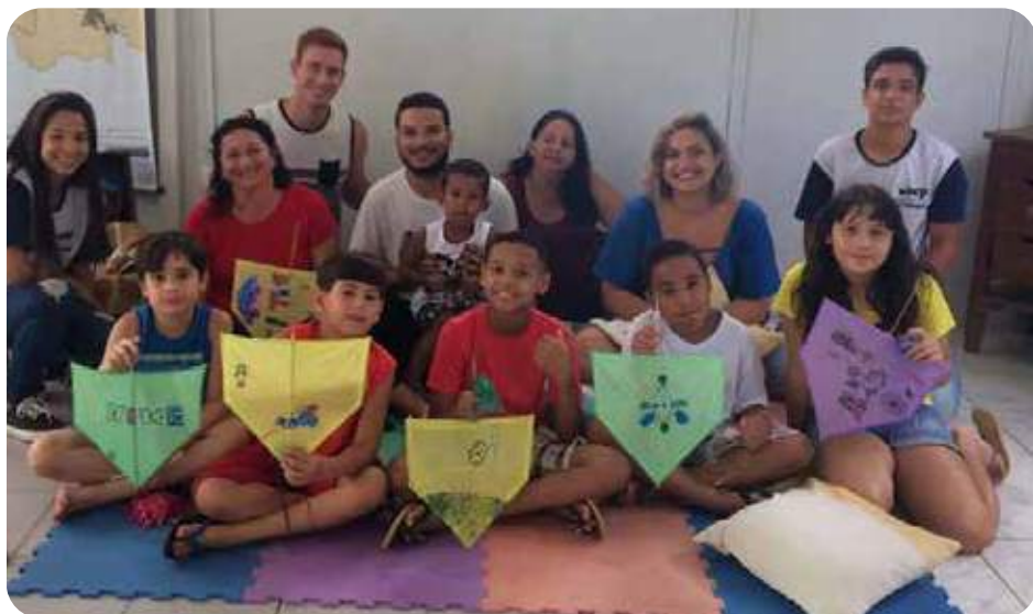
Oficina de Pipa (SEMUC, 2018)