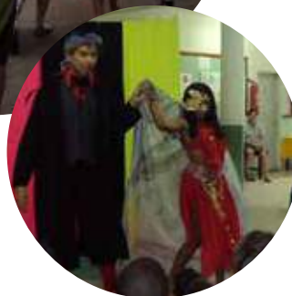
Trupe "Caí na Cena" Apresentação de "O Tapa Beco" (Projeto Encenação e Arte SEMUC, 2012)