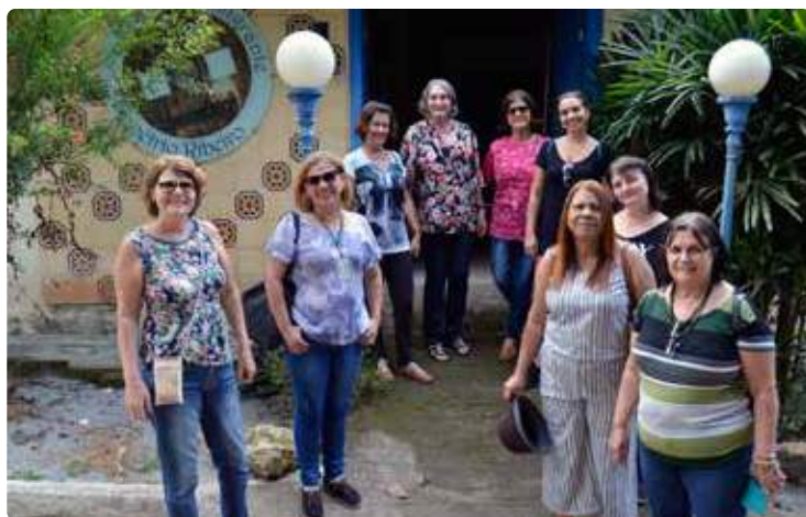
Museu do Imigrante (2018) Demétrio Ribeiro, João Neiva - ES

Recepção de turistas e estudantes nos Museus de João Neiva.